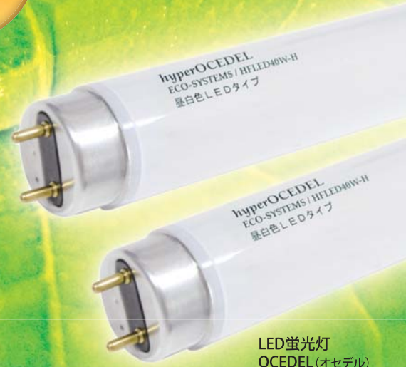
LED蛍光灯 OCEDEL (オセデル)